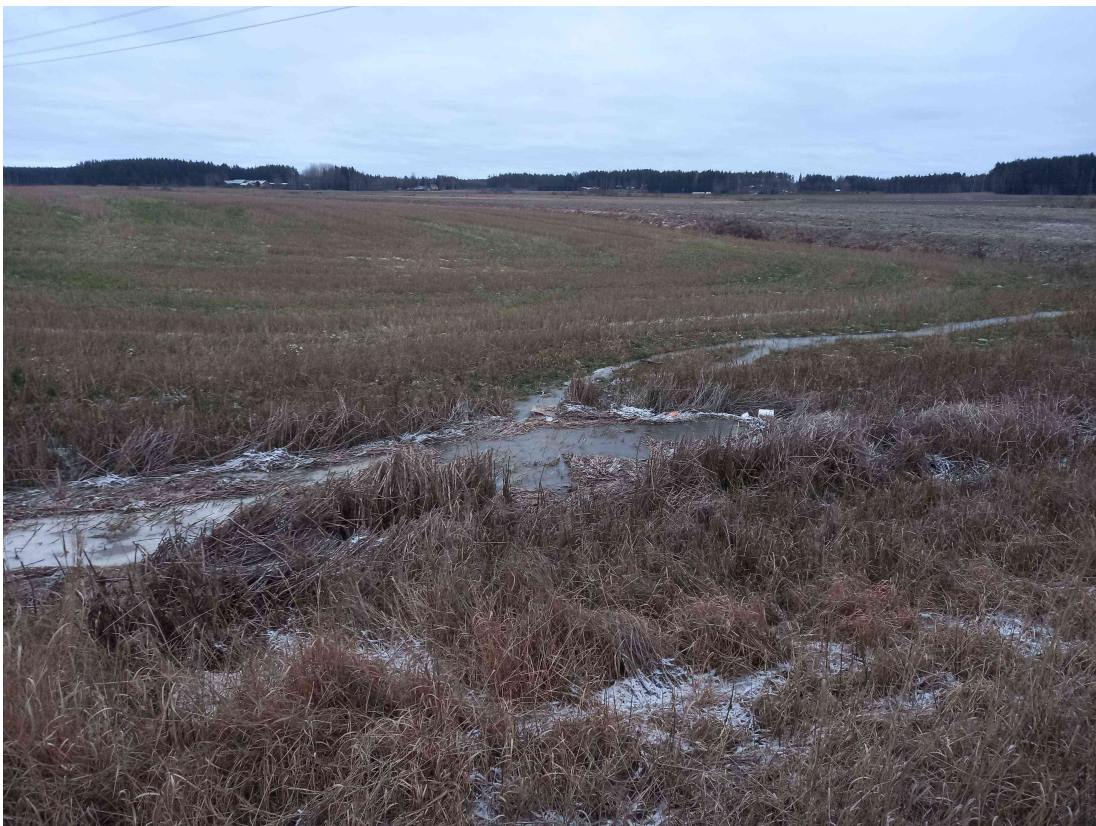
Kuva 2: Pohjoinen rajaoja