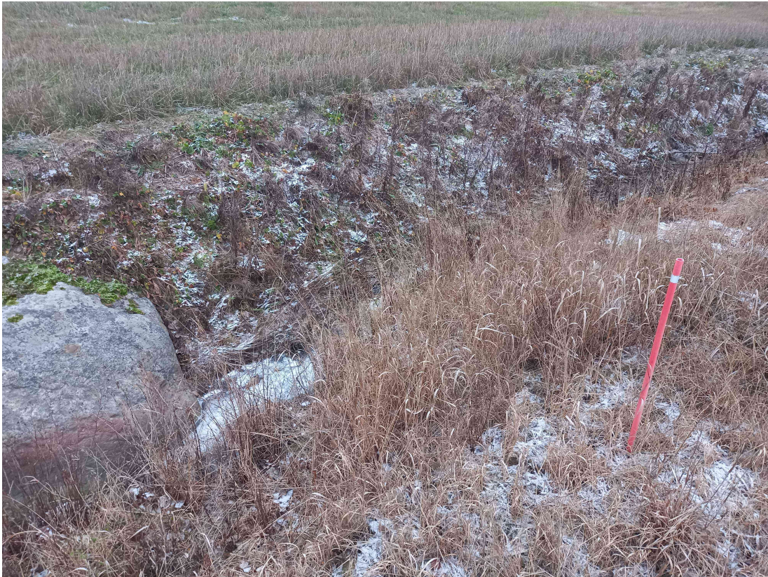
Kuva 1: Pohjoisen rajaojan ongelmien alkukohtana pidetty kivi