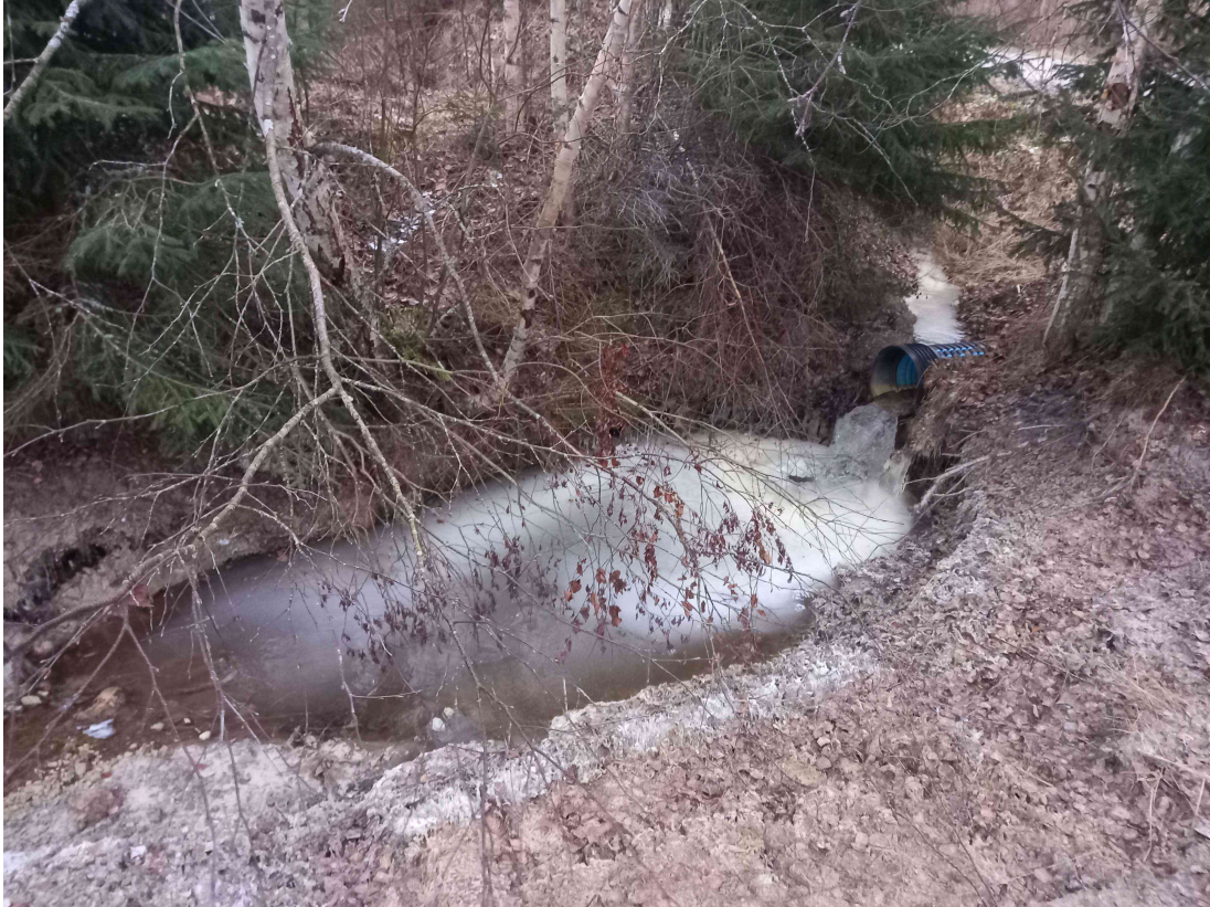
Kuva 7: Eteläinen rajajoja, Koivulantien alitus