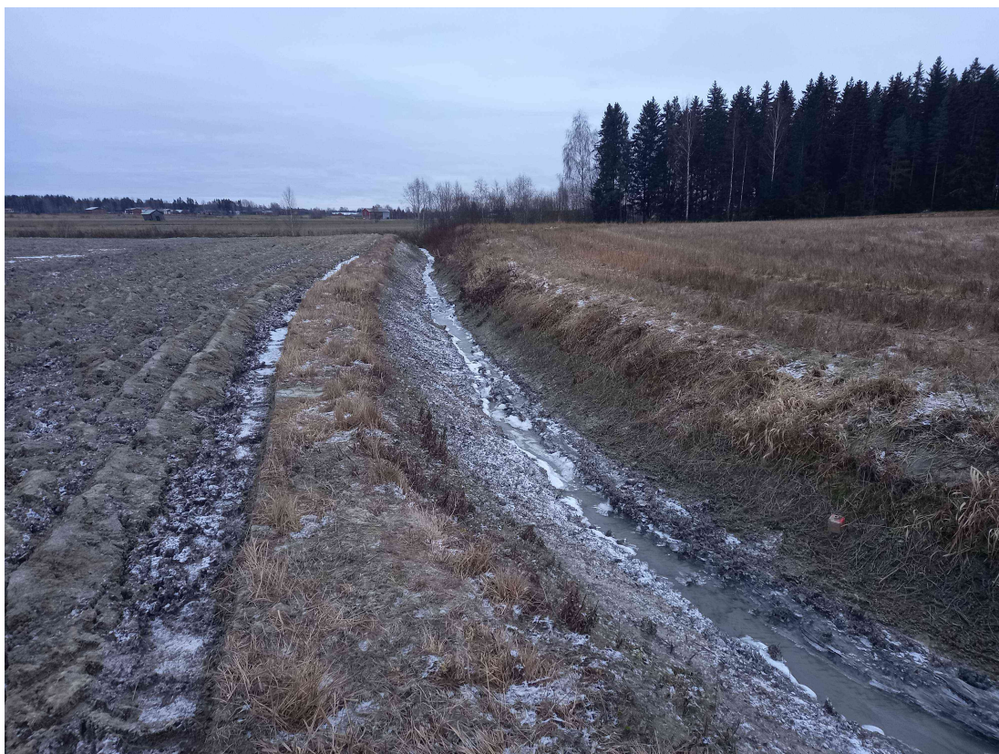
Kuva 6: Itäinen rajaoja, kaakkoon päin