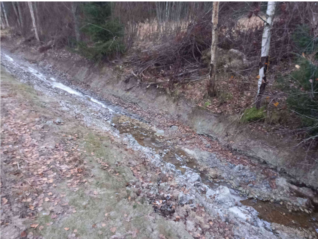
Kuva 8: Eteläistä rajajojaa, etelään päin