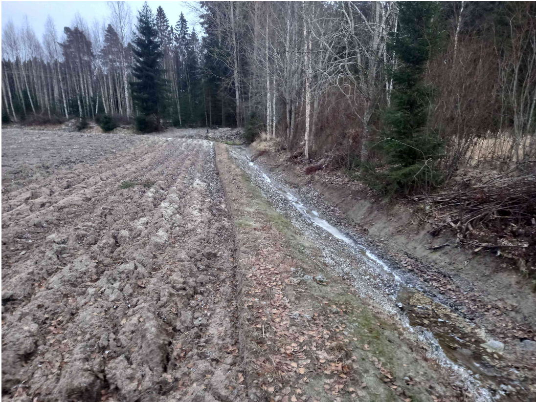
Kuva 9: Eteläinen rajaoja, kaakkoon päin