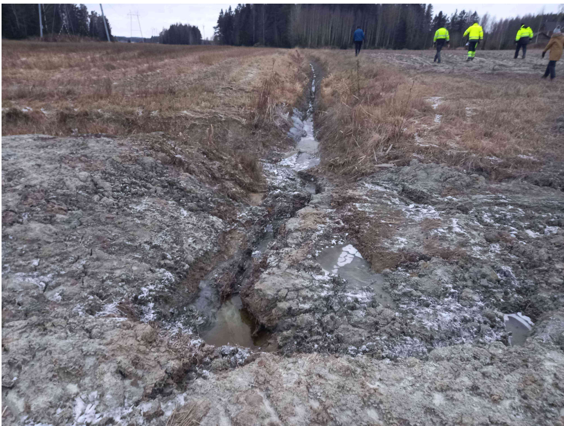
Kuva 4: Ojien risteyskohta, etelään päin