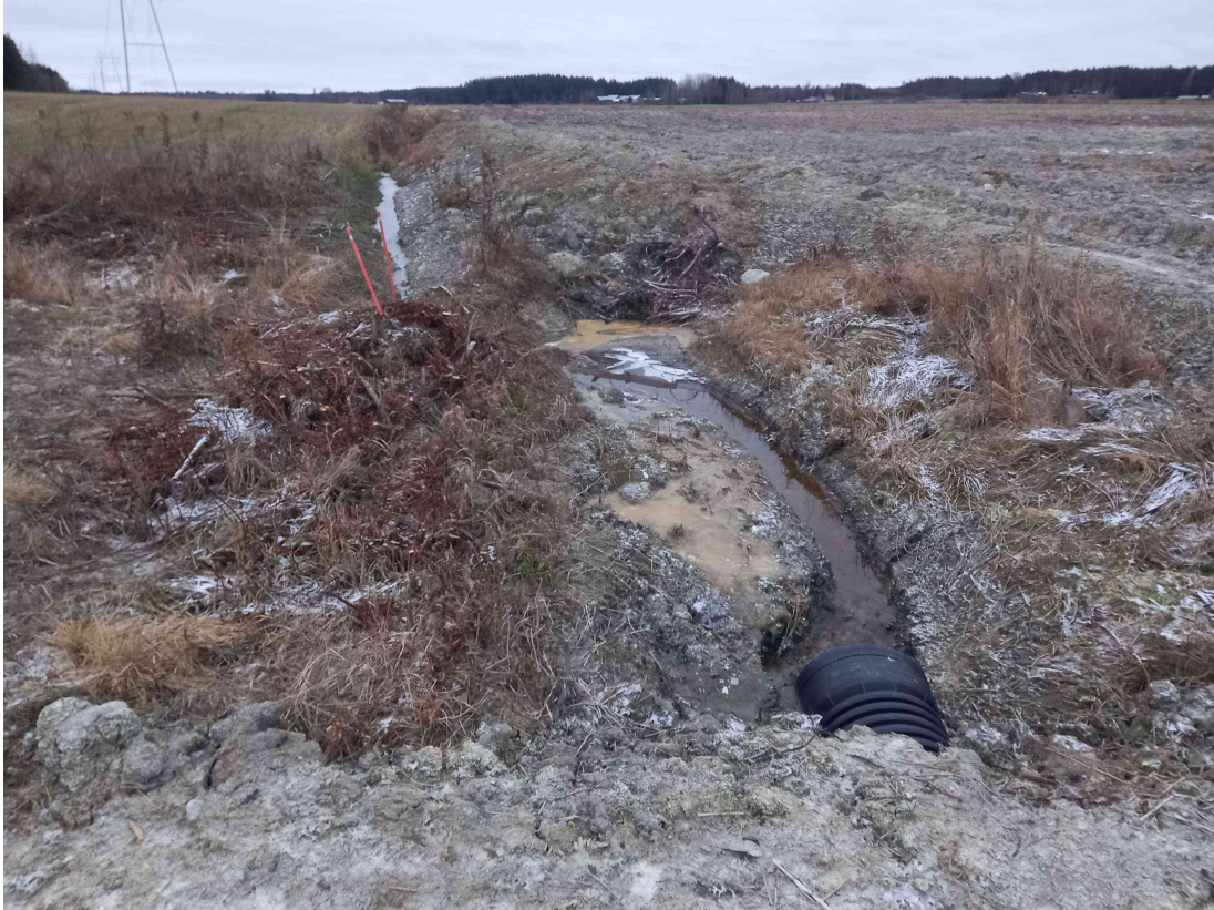
Kuva 3: Pohjoisen rajaojan laskukohta, kolmen kiinteistön risteymässä, pohjoiseen päin