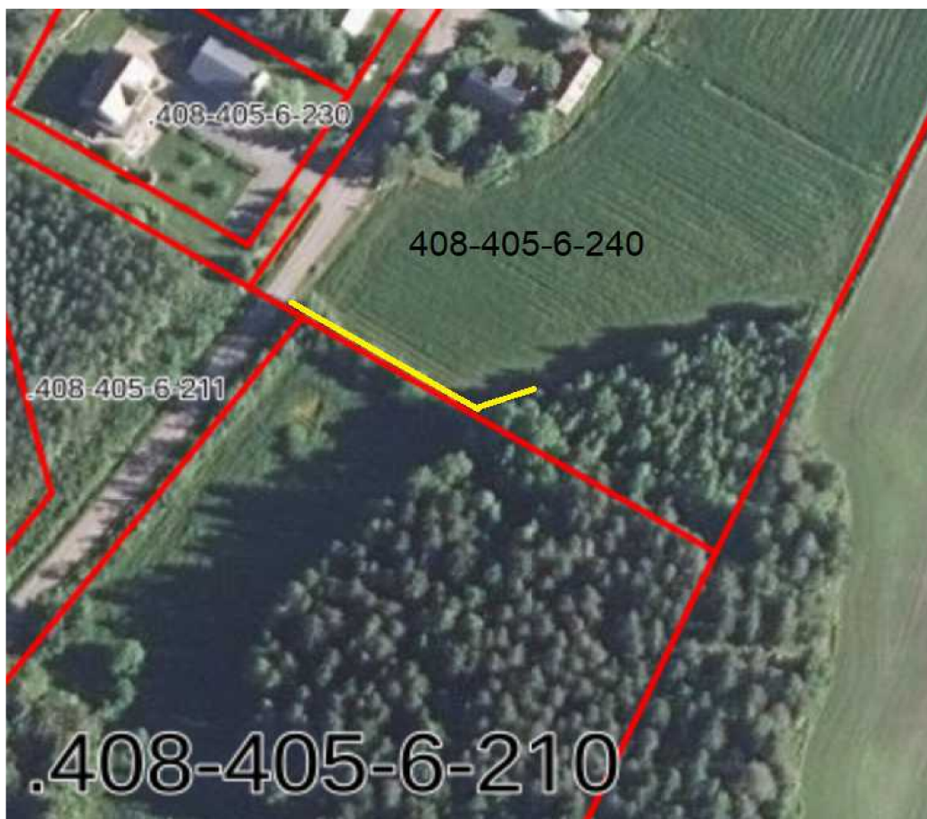
Kuva 2: Keltaisella ehdotettu salaojitus tai putkitus. Eteläinen rajajoja