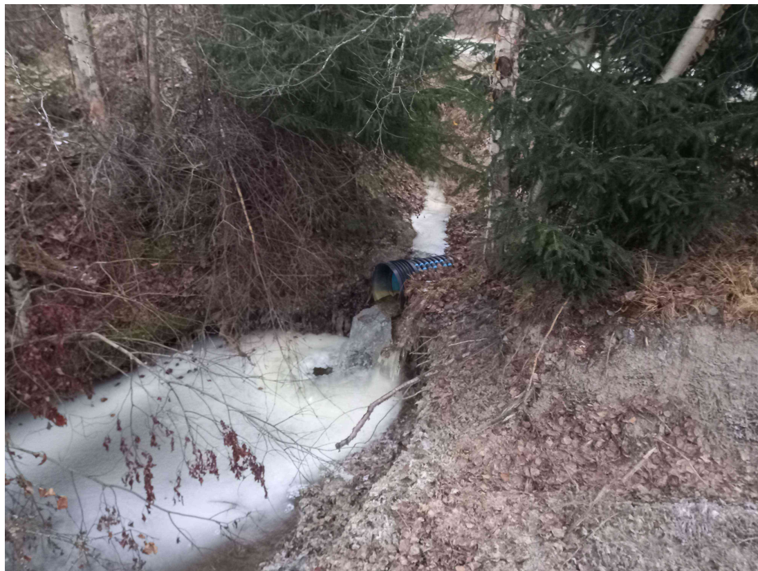
Kuva 10: Eteläinen rajaoja, tien ali kulkeva rumpu