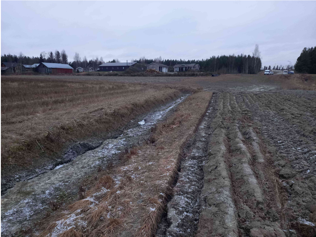
Kuva 5: Itäinen rajaoja, länteen päin